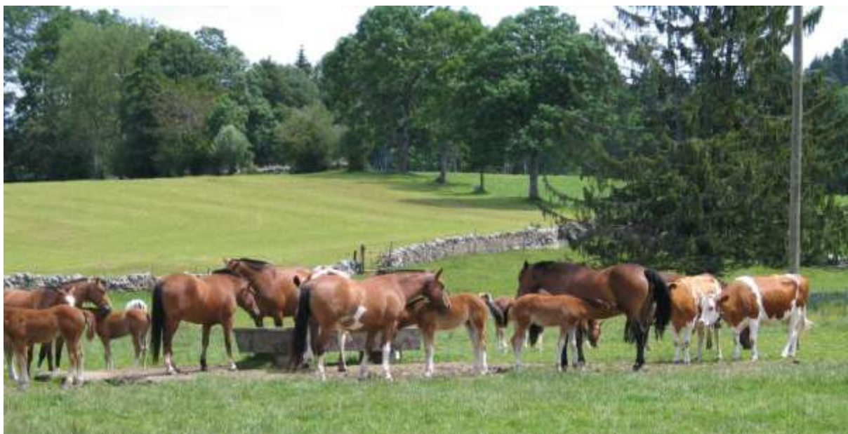
Pastorale printanière autour de la fontaine avec muret à l'arrière plan.

Employer les bonnes choses du passé pour un avenir meilleur !