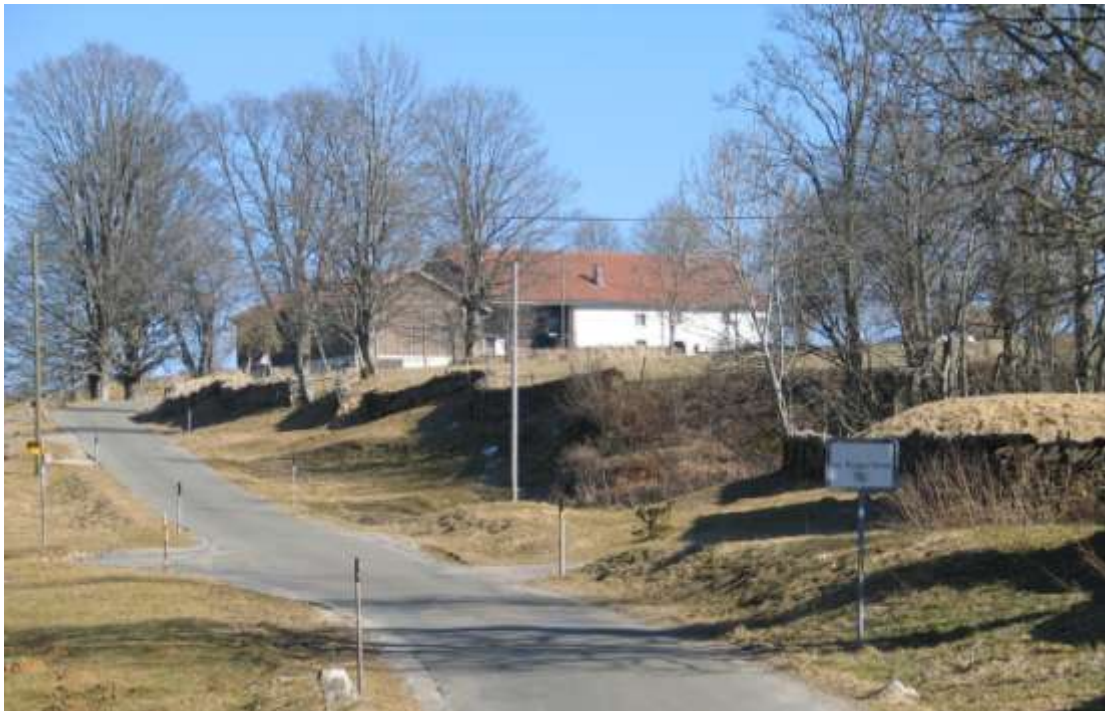
L'entrée du hameau

Cette année, elle prévoit des restaurations sur des sites exemplaires, placés essentiellement dans des plans de zone sous protection ; soit communal ou/et cantonal.