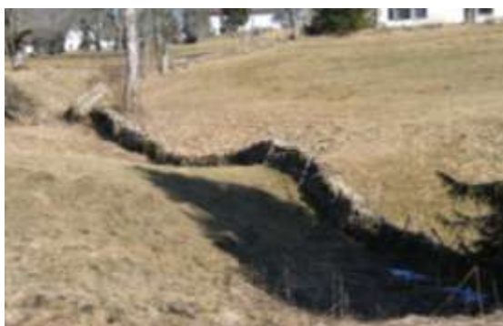
Muret soulignant les courbes du terrain

Sur cette carte de la commune du Bémont, on peut constater que le hameau des Rouges-Terres est très riche en murets qui requièrent une cure de remise en forme. Les bases du lit sur certains tronçons sont à refaire complètement, à d'autres endroits le mur c'est renversé et laisse une brèche béante dans le réseau qu'il constitue. Souvent il faut stabiliser la couronne et la compléter. La pierre utilisée est petite et fine, elle provient essentiellement des labours. Il est aussi très important de faire l'entretien de ses abords, retirer les nouvelles pousses d'arbres qui les menacent d'une destruction inexorable.