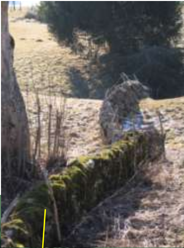
Muret plongeant dans une doline

D'entente avec le service du patrimoine historique, l'aménagement du territoire, les autorités communales et les propriétaires fonciers, une collaboration sera organisée et certains frais seront assurés par des fonds communaux destinés à l'entretien des pâturages.